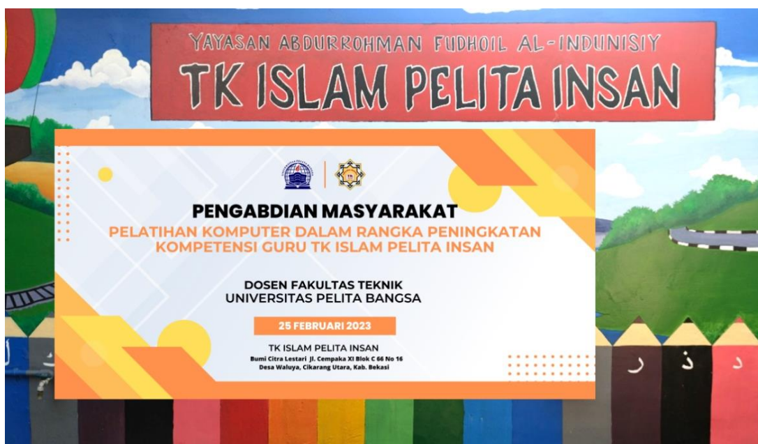
Gambar 2. Foto Kegiatan

Pelatihan perangkat lunak ini merupakan sarana yang ditunjukkan pada upaya untuk meningkatkan kemampuan guru TK Islam Pelita Insan dalam penggunaan dan pemanfaatan aplikasi Microsoft Office dalam mendukung proses kerja dan pembelajaran.