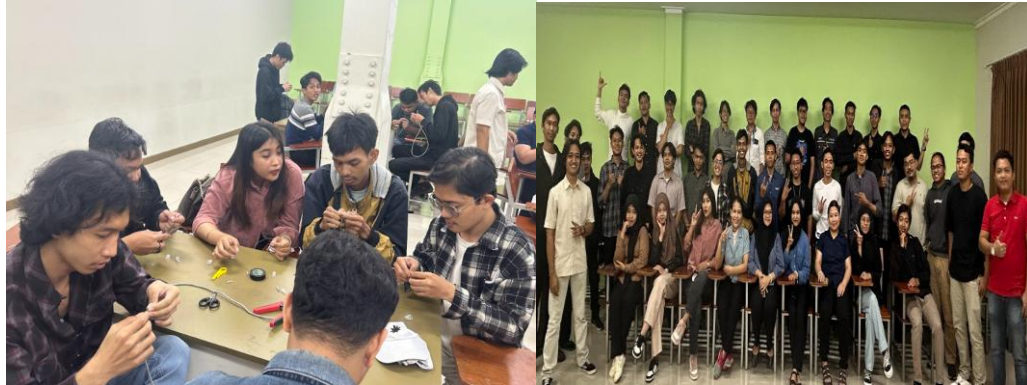
Gambar 1. Praktik Cramping Kabel

Pada tahap praktik di Gambar 1, peserta mampu mengikuti prosedur pemasangan kabel secara bertahap, mulai dari memotong kabel, mengupas lapisan luar kabel, menyusun urutan warna kabel, merapikan ujung kabel, memasukkan kabel ke konektor RJ-45, hingga menjepit konektor menggunakan crimping tool . Kesalahan yang paling sering terjadi pada awal praktik adalah susunan warna kabel yang tidak sesuai standar, ujung kabel tidak rata, serta posisi kabel tidak masuk sempurna ke dalam konektor RJ-45. Melalui pendampingan langsung, peserta dapat memperbaiki kesalahan tersebut dan menghasilkan kabel jaringan yang lebih rapi dan layak digunakan.