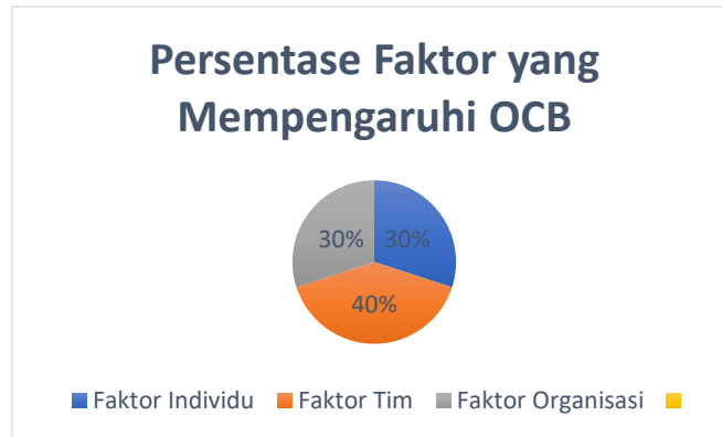
Gambar 2. Grafik Faktor yang Mempengaruhi OCB

Grafik berikut menyajikan distribusi faktor-faktor yang memengaruhi Organizational Citizenship Behavior (OCB) dalam konteks kerja tim berdasarkan hasil analisis literatur yang telah dilakukan: