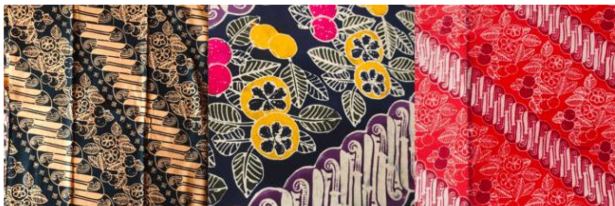
Gambar 1. Batik

Batik Nusantara adalah seni tekstil tradisional Indonesia yang menggunakan teknik pewarnaan kain dengan pola yang khas dan beragam. Setiap daerah di Nusantara memiliki ciri khas batik yang mencerminkan budaya, sejarah, dan filosofi setempat. Misalnya, Batik Jawa terkenal dengan pola klasik seperti parang dan kawung, sementara Batik Pekalongan memiliki corak yang lebih bebas dan penuh warna. Proses pembuatan batik melibatkan teknik tulis menggunakan canting (batik tulis), cap menggunakan alat cetak (batik cap), atau kombinasi keduanya. Batik Nusantara telah diakui UNESCO sebagai Warisan Budaya Takbenda Dunia, menjadikannya simbol kekayaan budaya Indonesia yang mendunia.