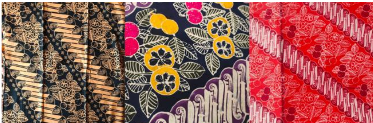
Gambar 1. Batik

Batik Nusantara adalah seni tekstil tradisional Indonesia yang menggunakan teknik pewarnaan kain dengan pola yang khas dan beragam. Setiap daerah di Nusantara memiliki ciri khas batik yang mencerminkan budaya, sejarah, dan filosofi setempat. Misalnya, Batik Jawa terkenal dengan pola klasik seperti parang dan kawung, sementara Batik Pekalongan memiliki corak yang lebih bebas dan penuh warna. Proses pembuatan batik melibatkan teknik tulis menggunakan canting (batik tulis), cap menggunakan alat cetak (batik cap), atau kombinasi keduanya. Batik Nusantara telah diakui UNESCO sebagai Warisan Budaya Takbenda Dunia, menjadikannya simbol kekayaan budaya Indonesia yang mendunia.